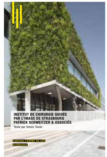
INSTITUT DE CHIRURGIE GUIDÉE PAR L'IMAGE DE STRASBOURG PATRICK SCHWEITZER & ASSOCIÉS Texte par Simon Texier

Collection L'ESPRIT DU LIEU Architecture