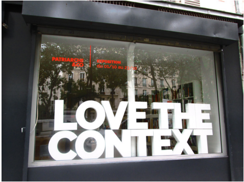
Patriarche & Co, Love the context