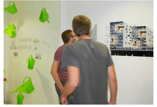
X-TU architects, TERA 11, une radicalité domestique