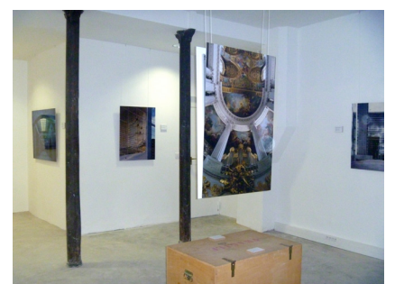
Georges Fessy, architectures 20 photographies