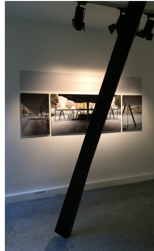
Laurence Carminati & Yann Keromnes architectes, Échelle 1