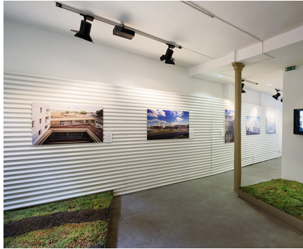
Croixmariebourdon Architectes Associés, Lisière Habiter / Travailler L'entre deux