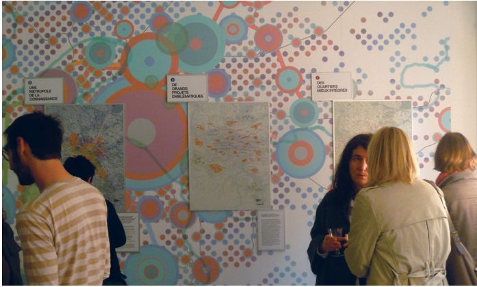
« 12 clefs de lecture pour comprendre le Grand Paris », AIGP