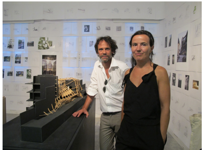
Chartier & Corbasson, Paris