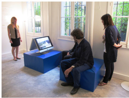
Lacaton & Vassal, Nantes