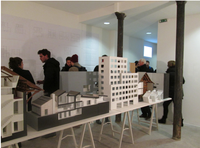
Charles Pictet Architecte, Projets choisis