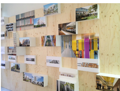
Léonard & Weissmann, Paris