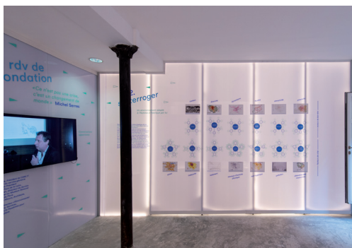
AIA Fondation, Ville et santé, un paradoxe