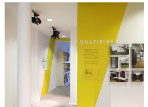
Arteo architectures, Lectures Diagonales